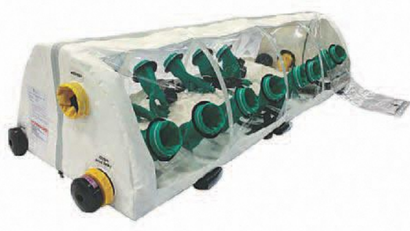
搬送用アイソレータ装置