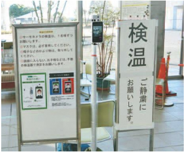
総合体育館入口で行っているサーモカメラでの検温