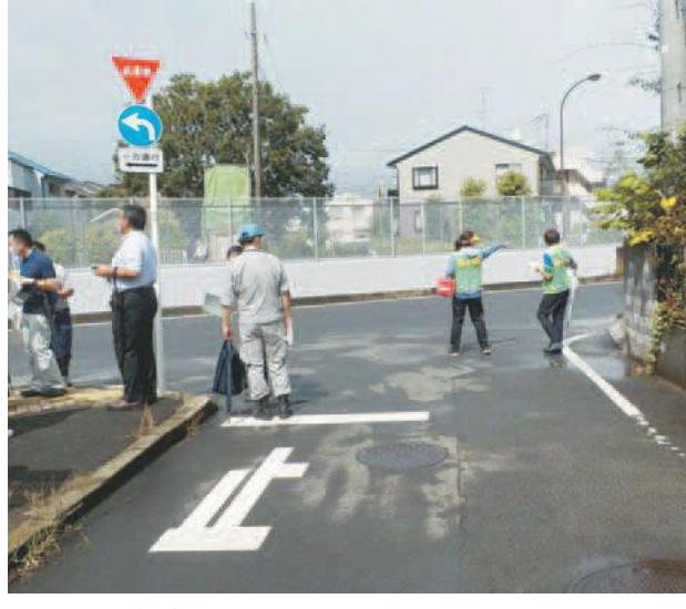
毎年行っている通学路合同点検