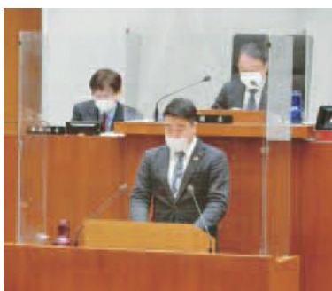
飛沫感染防止のためパーティションを設置して行った本会議

を確保するための継続した財政支援を強く要望する。 以上、地方自治法第99条の規定により意見書を提出する。 令和2年12月16日 稲城市議会議長 渡辺 力 内閣総理大臣、厚生労働大臣、東京都知事 殿