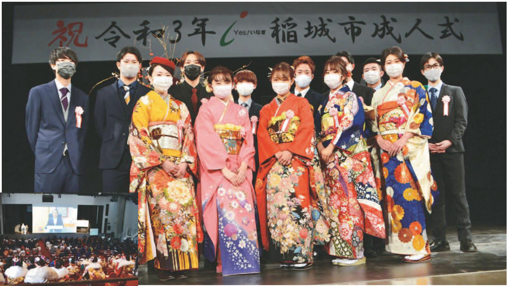
令和3年稲城市成人式（令和3年1月11日実施）実行委員会