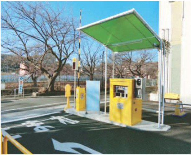
3月28日から有料となる予定の市役所駐車場