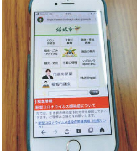
スマートフォンから見た稲城市公式ホームページ