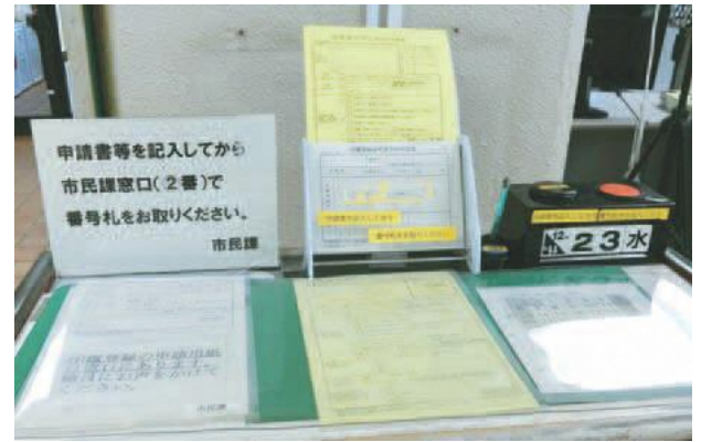
市役所1階の市民課の記載台

答 市では、国の緊急事態宣言解除を受け、市内体育施設の利用を再開するに当たり、屋外・屋内、有人・無人など、体育施設の形態ごとに使用再開要件を定め、指定管理者がこれを基に施設に適した詳細な感染防止対策を定めることで、利用者が安全に安心して利用できるよう努めている。