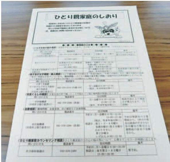
子育て支援課で発行している「ひとり親家庭のしおり」

問 「離婚前後親支援モデル事業」の当市の検討は。児童手当について、子どもと同居している実質的ひとり親家庭に支払われるべきであり、受給者変更手続きに関する周知と実態に合わせた支給の点検が行われているかの確認は。