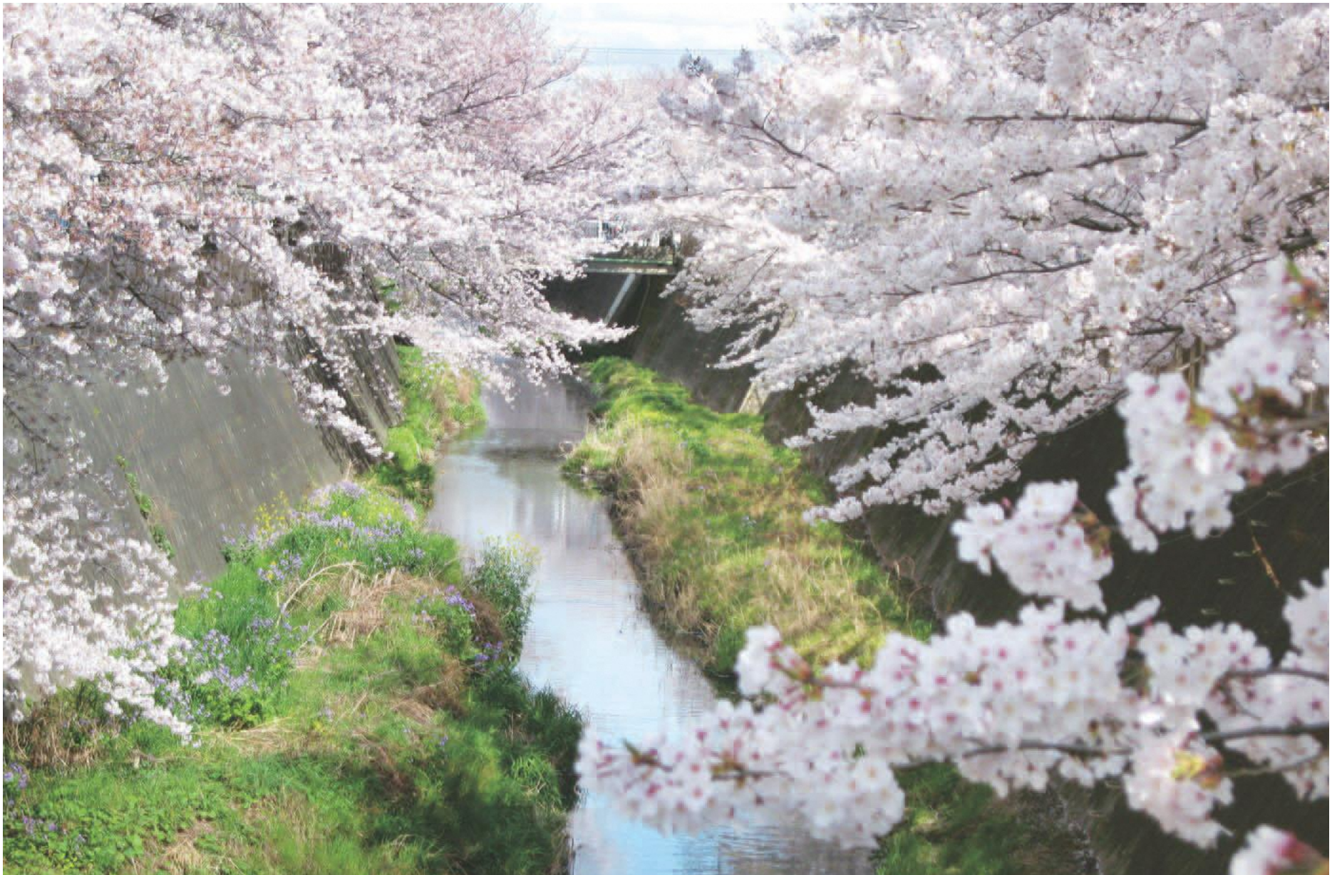
三沢川に咲き誇る満開の桜