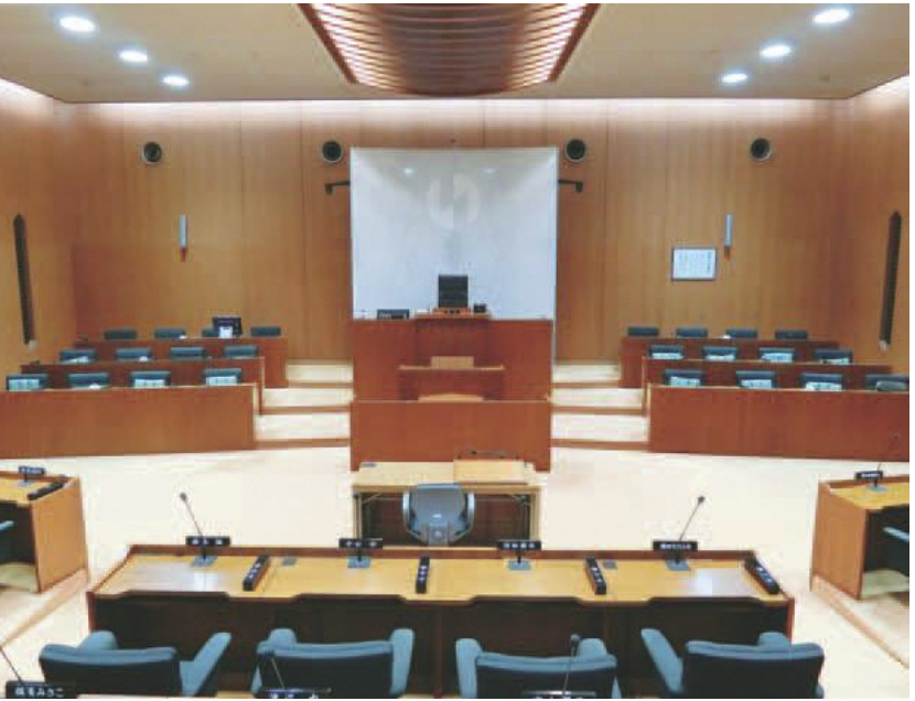
3月27日の本会議で6人の議員が予算案に対し賛否の討論を行いました。

今年度の予算ベースには「持続可能な行政運営を維持するためには、市民に対して適正な受益者負担を求めていく」という考え方が大きな位置を占めており、その考え方も含めて、予算に賛成する。