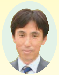
日本共産党 岡田 まなぶ