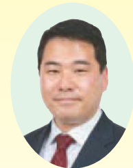
起風会 中田 中