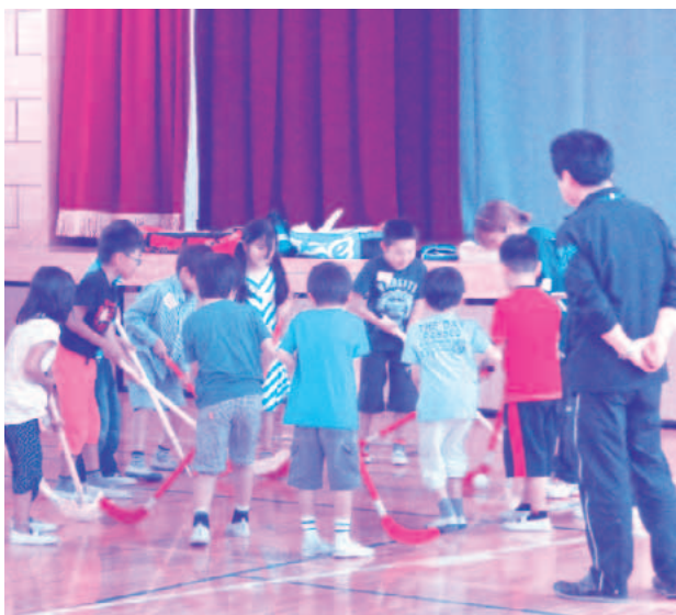
放課後子ども教室 (稲城第二小学校)

かわる全ての職員・臨時職員が、地域の方からのボランティアの申し出に対し、いつでも受け入れられる態勢にしたいと考える。また、今後設置予定の放課後子ども教室運営委員会に諮り、委員の意見を参考に対応を考えたり、人材バンクを活用するなど、積極的に取り組みたい。 問 地域の方々のかわりや学校との連携により、今後どのような事業展開を想定しているのか伺う。