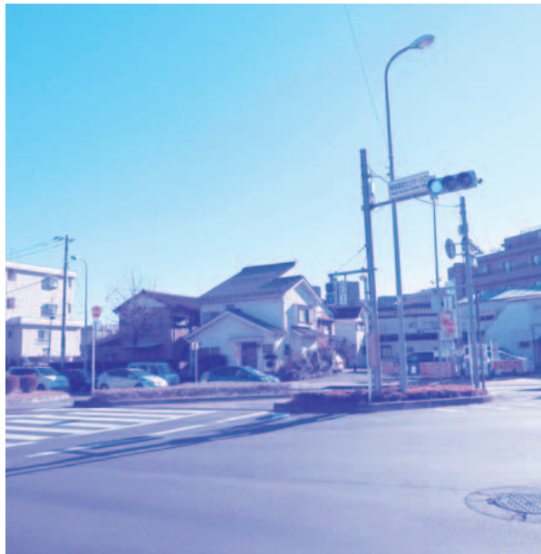
福祉センター前交差点に設置されている信号機

問 今後とも改善を図るとい認識で良いのか伺う。 答 交通人身事故の状況は、平成25年中は3件、26年中は2件、27年10月末現在では6件の発生があり、その約7割の8件が追突事故であることから、信号サイクルの問題ではなく、運転者側の問題と考えている。しかし、死亡事故が発生しているため、可能な安全対策の検討を、多摩中央警察署に協議していく。 問 何度も取り上げている平尾自治会館前の信号機の早期設置については、東京都公安委員会にて検討中と認識しているが、現状の段階と今後