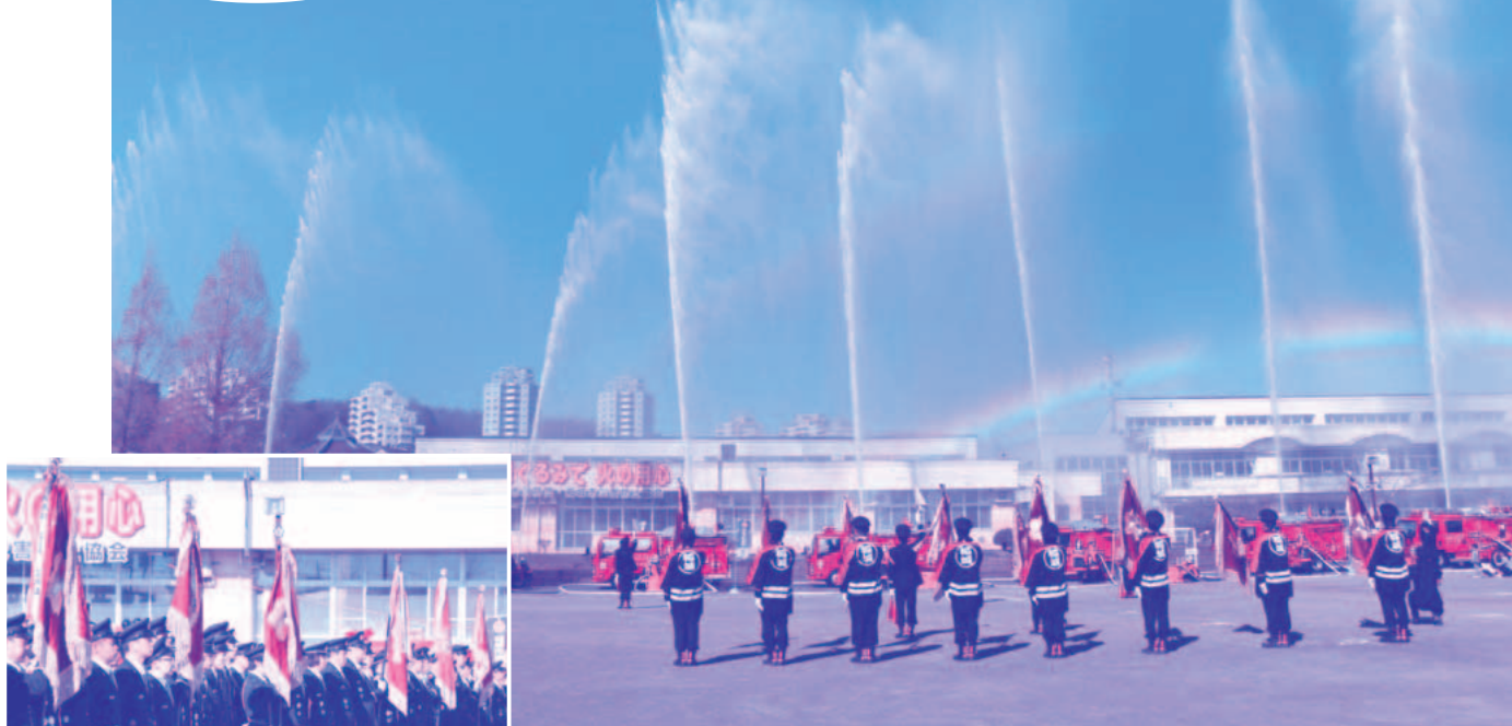
稲城市消防出初式（向陽台小学校校庭）