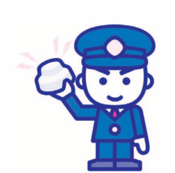
住宅用火災警報器シンボルキャラクター「消太」

問 今年と比較して火災件数が増加し、4月には住宅火災で1名が亡くなっている。住宅火災による死者を減らすために、早期に火災を発見するためには、住宅用火災警報器は非常に有効である