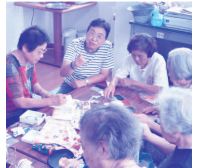
介護支援ボランティア活動の様子

介護支援ボランティア制度の登録者の推移については、平成19年度末237人、20年度末299人、21年度末381人、22年度末424人、23年度末468人、24年度末521人、25年度末574人、26年度末623人、27年度10月末665人となっております。毎年増加している。