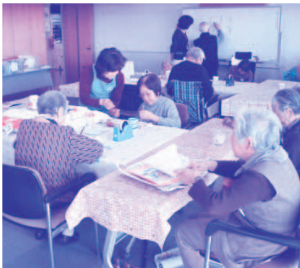
介護支援ボランティア活動の様子

問 その他、相馬市との地道な市民交流、街路樹の桜の木に付く毛虫対策等、川崎街道の歩道の安全対策、向陽台3丁目付近のバス通り沿いにある停車スペース、本庁舎の分煙対策、ビブリオバトルを活用した「言葉の力」