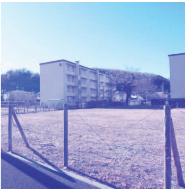
都営第1アパート跡地

答 商業施設の誘致については、稲城第二中学校東側に位置する坂浜平尾線と学園通りの交差点の角に約9400平方メートルを予定している。