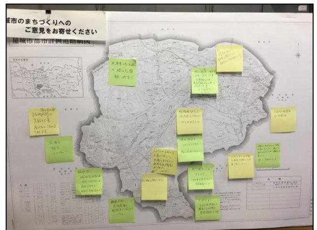
皆さまから自由なご意見を付箋に記載していただき、地図に張り付けていただきました。