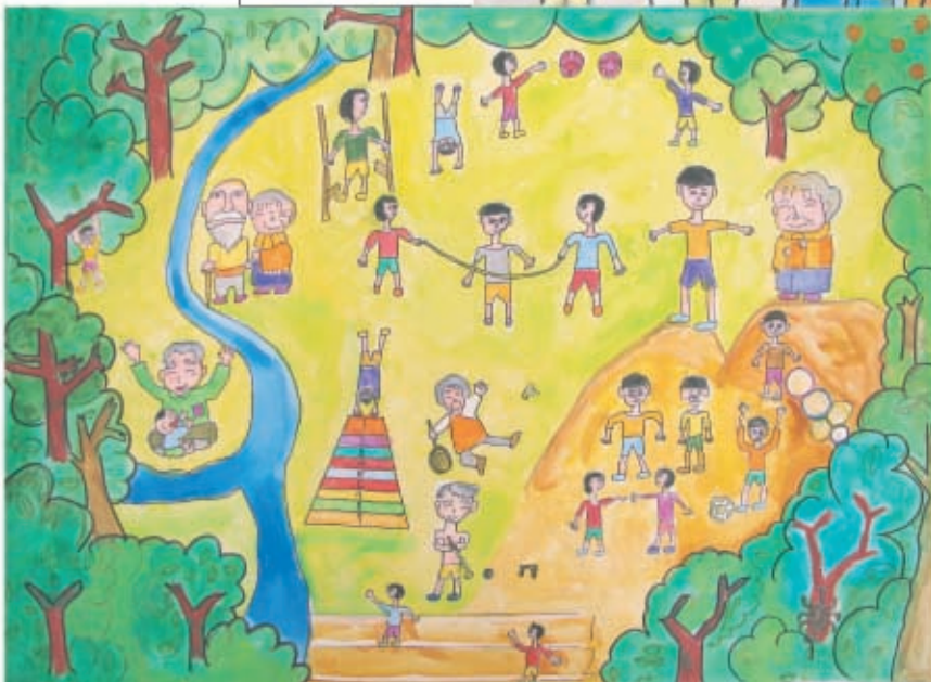
お年寄りや 子どもたちの 笑顔が光る町 —稲城