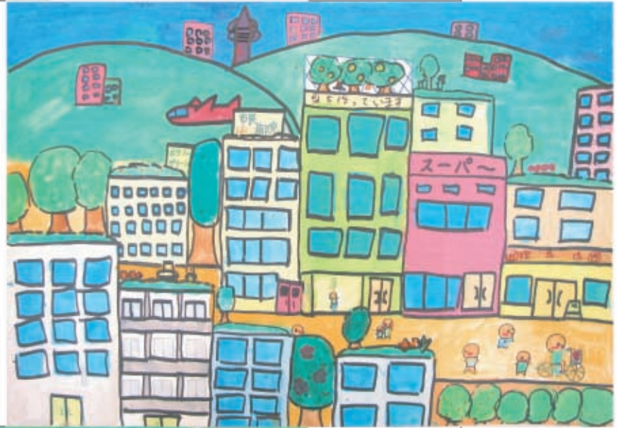
未来の稲城 の風景