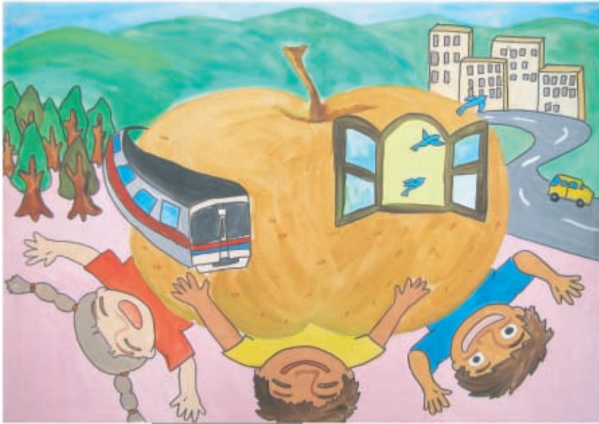
未来へ (緑いっぱい 稲城)