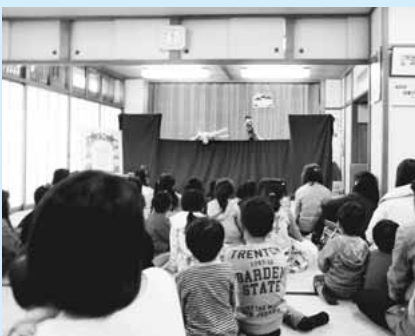
▲人形劇 食べられた魔女

■内容 第二次稲城市子ども 読書活動推進計画の紹介 【第二部】紙芝居と人形劇の会 (児童対象) ■時間 午後3時～4時 ■内容 ①『舌をぬかれたお 獅子』いなぎの昔ばなし紙 しばい ②人形劇とおはなしのスーホ の会による「人形劇 食べら れた魔女」 ▽会場 城山体験学習館(中央 図書館隣) ▽申込み 不要。第二部のみの 参加もできます。 ▽問合せ 第一図書館