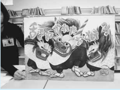
▲いなぎの昔ばなし紙しばい

立図書館での団体貸出の充実」 を重点的取組みとして、子ども の読書活動を推進していきます。 ※計画は各図書館、市のホーム ページでご覧いただけます。