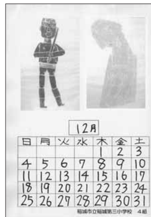
稲城市立稲城第三小学校4組の皆さんの作品です。

編集・発行 稲城市教育委員会教育部生涯学習課 〒206-8601 稲城市東長沼2111 ☎042-377-2121 042-379-0491