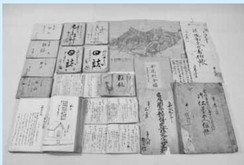
▲鈴木家文書（市指定文化財）