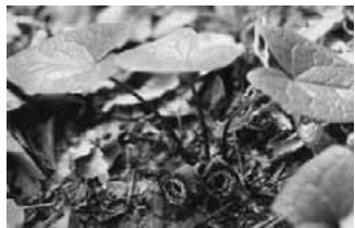
▲タマノカンアオイ

現在では多摩丘陵を主産地とし、西は高尾山、北は狭山丘陵、東は府中市浅間山、南は横浜市北区恩田町までの、ごく限られた地域に分布していることがわかっています。 このようなタマノカンアオイは、生育場所を広げる速度がとても遅いのも特徴です。 茎は1年に1〜2cmほどしか伸びず、成体になるまでに10年はかかるそうです。 その場に落ちてしまつたので、自分ではほとんど生育地を広