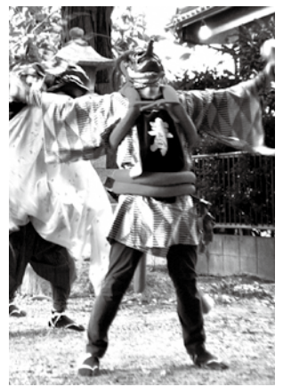
青清神社獅子舞 (稲城市指定文化財)

編集・発行 稲城市教育委員会教育部生涯学習課 〒206-8601 稲城市東長沼2111 ☎042-377-2121 042-379-0491