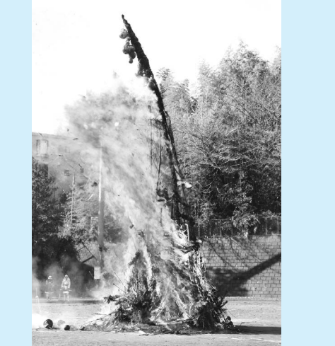
▲寒の神行事(平尾地区) (1月13日・ふれんど平尾) 正月の松飾り等を集めて燃やし、炎に無病息災の願いを込めて焚き上げられました。

定各30人(申込先着順) ④ 34歳以下対象 「合同就職面接会」 2月26日(水) 時午後1時～4時 定25社程度の企業が参加予定 面接する企業分の履歴書 ※予約不要 場②京王プラザホテル八王子、その他 東京しごとセンター多摩