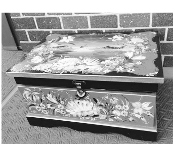
▲ツールペイント作品

場先岡あいしヨップ(大丸118の5 川崎街道東長沼交差点南) ☎377-6546