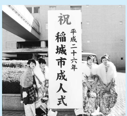
▲平成26年稲城市成人式 (1月13日・駒澤学園記念講堂) 今年は男性448人、女性431人、合計879人が新たに大人の仲間入りを果たしました。