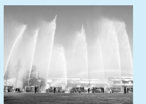
▲稲城市消防出初式 (1月12日・向陽台小学校) 新春恒例の消防出初式が行われ、一般市民を含む1,104人の方が参加されました。写真は、消防ポンプ車から高々と上げられた一斉放水です。