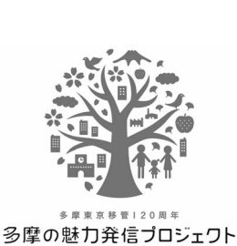
多摩の魅力発信プロジェクト

30市町村は連携・協働して、多摩地域の魅力を住民が再発見し、発信していく「多摩の魅力発信プロジェクト」を、年間を通じて展開しています。その一つとして、イベントを開催します。 ☎3月15日(土) ☎時間 午前9時30分~午後4時 ☎場所 国営昭和記念公園みどりの文化ゾーン ☎内容 【ニューススポーツEXPO in 多摩 2014】①ニューススポーツの体験コーナー、②多摩飲食ブース、③ステージパフォーマンス 【たま発! in Springs】 ①「当地キャラ大集合」、②「たま発!お笑いライブ」、③「たま発!フォトコンテスト」入賞作品展示、④「たま発!」ワークショップ ※各イベントの詳細は、各問い合わせ先に記載のホームページ