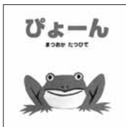
ぴょーん まつおか たつひで/ポプラ社