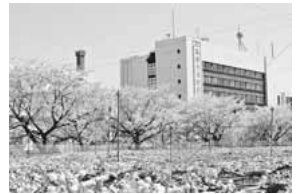
「梨と桜の共演」(稲城市フォトギャラリー投稿作品)

発行 東京都稲城市 編集 秘書広報課広報広聴係 〒206-8601 東京都稲城市東長沼2111 ☎042-378-2111 042-377-4781