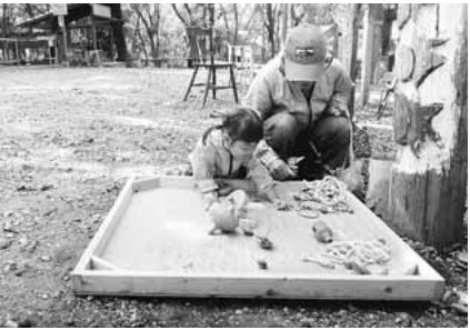
▲昨年の森のたからばこの様子

②平成24年7月9日に16歳以上の方で登録を受けた後の7回目の誕生日が平成27年7月8日までに到来する場合(平成24年7月9日に既に到来している場合を含む) 平成27年7月8日 ③②でいう誕生日が平成27年7月9日以降に到来する場合 登録等を受けた後の7回目の誕生日 ※紛失等の再交付や記載事項に変更のある方はお問い合わせください。 ○市民課戸籍係 ○稲城市市民課戸籍係、外国人在留総合インフォメーションセンター ☎0570-013904