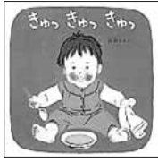
きゅつきゅつきゅつきゅ 林 明子/福音館書店