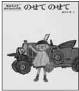
のせてのせて 松谷 みよ子・文 東光寺 啓・絵/童心社