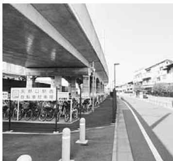
▲矢野口駅周辺の側道整備完了区間

これまでに、矢野口駅・稲城長沼駅・南多摩駅の3駅を含む事業区間4.3kmの高架化が完了し、15箇所全ての踏切を撤去しました。今後は、高架橋に沿った側道の整備(幅員6.0m×8.0m)を行います。側道整備を実施することで①道路ネットワークの形成促進 ②円滑な消防・救急活動に寄与 ③駅までのアクセス向上 ④高架橋による日照対策など、様々な効果が得られます。