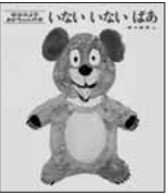
いないないばあ 松谷 みよ子・文 瀬川 康男・画/童心社