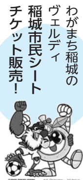
わがまち稲城のヴェルディ 稲城市民シート チケット販売!

妊婦さんとそのパートナー ☎4月18日(土) 時午前10時～午後1時 場駒沢女子大学調理実習室 定20人 ※応募多数の場合は抽選 ※当選者には後日連絡します。 費500円 申①氏名、②連絡先(住所・電話)、③出産予定日を明記のうえ、郵送またはメールでお申し込みください。詳細は「駒沢女子大学」ホームページをご覧ください。 限4月10日(金)