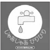
じゃあじゃあびりびり まつい のりこ/偕成社