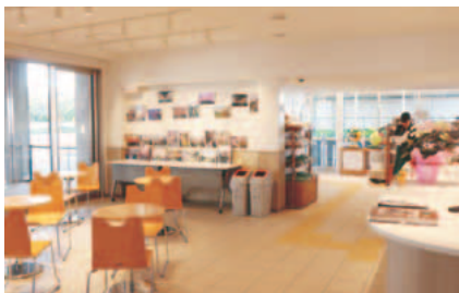
▲いなぎ発信基地ペアテラスの内装

4月23日、JR南武線稲城長沼駅高架下に観光発信拠点をオープンしました。本施設を開業できたのは連続立体交差事業が完了したからであり、東京都建設局及びJR東日本八王子支社にはこの場をお借りして感謝いたします。