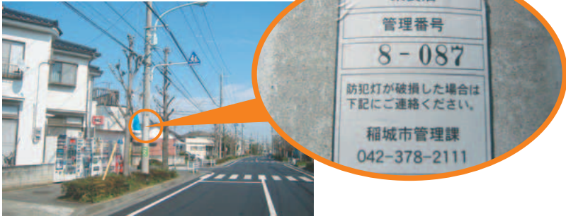
街路灯・防犯灯の一例