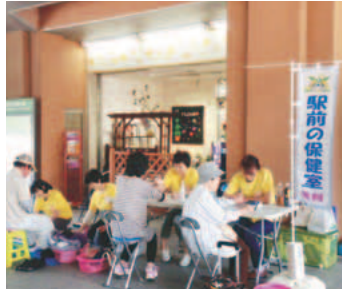
▲駅前保健室の様子