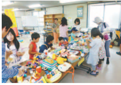
▲カエルポイントで「とりかえっこ」