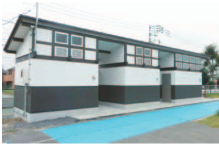
▲8月1日にオープンしました