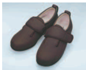
▲みまもりタグ専用靴