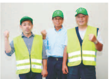
▲農業委員が丁寧に教えます。

援農ボランティア制度は、高齢化や担い手不足により営農継続が困難になった農業者に対して、農業支援に意欲のある方に作業を無償で補助していただくとともに、農業者と交流することにより農業への市民理解を深めることを目的としています。