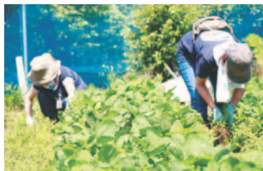
▲農業者を手伝い、稲城市の農業を豊かにします。

1月19日に開講したこの塾は、稲城市における初の援農ボランティア養成講座です。私が塾長を務め、農業委員会会長が世話人となり、座学の講師はJA東京みなみ稲城支店の職員に、実習の講師は農業委員にお願いしています。