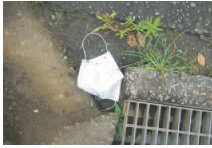
▲発見されたマスクのポイ捨て

市内でマスクのポイ捨てが増加しています。「稲城市まをきれいにする市民条例」では、ごみのポイ捨ては禁止されています。まちなみを損なうだけでなく、新型コロナウイルス感染症の拡大を防ぐためにも、路上・公園・民有地などへのマスクのポイ捨てはやめましょう。