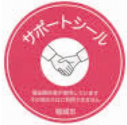
▲ごみ出し支援サポートシール

○長さ2m以内 ○太さ直径8cm未満 ○持ち込み禁止物 葉付きの枝・草・芝・落ち葉・農作物・竹・材木・毒性のある樹木・腐食した樹木など