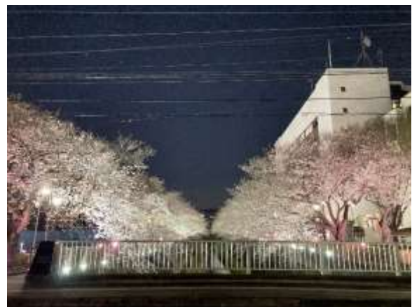
↑昨年のライトアップの様子