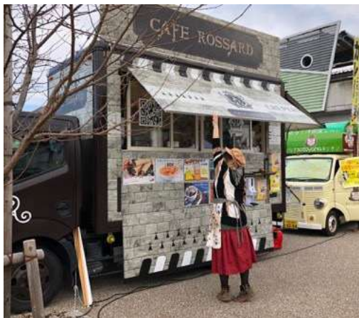
↑キッチンカー(イメージ)