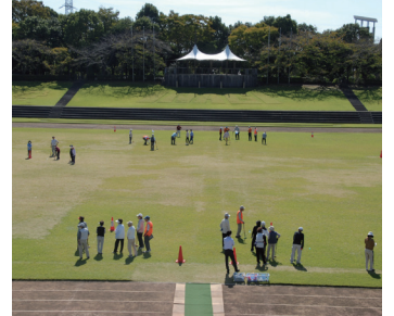
▲グラウンドゴルフ大会

グラウンドゴルフ・スナック ゴルフ・レクダンス等の軽ス ポーツ活動、カラオケ、民謡、 手芸、友愛活動に取り組んで います。各クラブの活動の詳 細は市HPをご覧ください。 お問い合わせ60歳以上の方 先居住する地域のクラブの代 表者(下表参照)