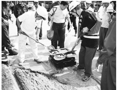
▲地域防災訓練の様子

今回はメイン会場となる稲城第二小学校の他に、市内4カ所の小学校体育館で避難所運営訓練を実施します。各地区に割り振られたサブ会場にお越しください(下表参照)。 10月30日(日) 午前9時30分～11時30分 場所 稲城第二小学校及び市内4カ所の小学校体育館 ※訓練当日午前9時30分にサイレンが鳴ります。火災と間違えないようご注意ください。 ※雨天決行(訓練は天候に関係なく行いますが、気象警報などが発令され、防災関係機関の警戒体制が必要となった場合などは、訓練の一部を変更