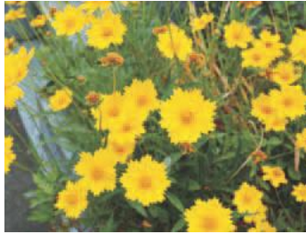
▲オオキンケイギク

※①～⑤=ファミリー農園(更新不可、水道設備無し)、⑥～⑧=農家開設型市民農園(更新可、⑥⑧は水道設備有り、⑦は水道設備無し)