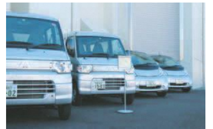
▲電気自動車の導入