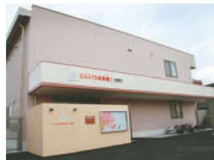
認可保育所にじいる保育園 矢野口