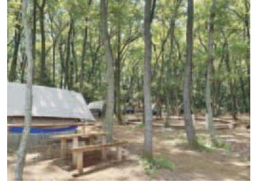
▲稲城ふれあいの森