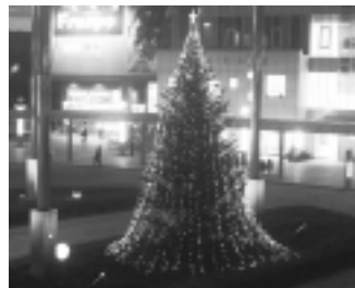
昨年のイルミネーション