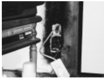
コンセントからの出火で焦げた壁

電気から発生する火災 家電製品は、日常生活の必需品となっています。この家電製品を使用するため電気を使いますが、電気の