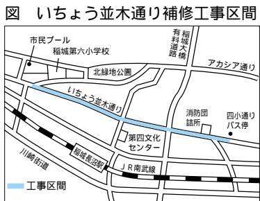
図 いちよう並木通り補修工事区間

いちよう並木通りで舗装の補修工事を行います。この工事を行うことで、車の走行時の騒音を抑え、路面の雨水の溜まりを防ぎます。工事は昼間に行ひ、工中は片側交互通行になります。工事期間中は大変ご迷惑をお掛けしますが、ご理解とご協力をお願いします。工事区域 第六小学校南側付近(四小通りバス停付近(左図参照))