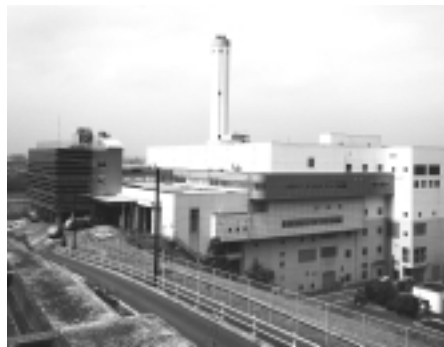
総合的なリサイクル施設を目指して

申し込み・問い合わせ Iのまちいなぎ市民祭実行委員会事務局(協働推進課協働推進係)