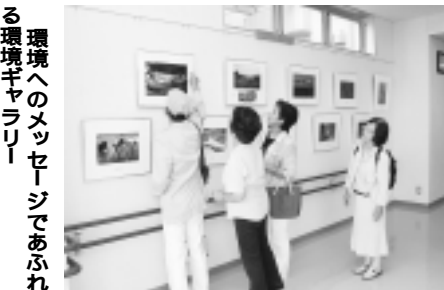
環境へのメッセージであふれる環境ギャラリー

クリーンセンター多摩川は、狛江市、稲城市、府中市、国立市の4市で構成する多摩川衛生組合が運営しています。収集されたごみを、より安全に効率よく処理するための清掃工場(ごみの中間処理施設)として、10年3月に完成しました。