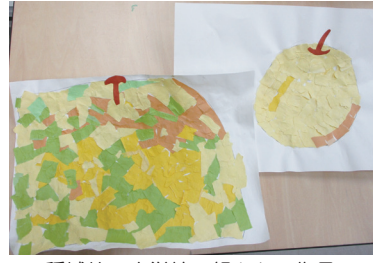
稲城第一小学校4組さんの作品