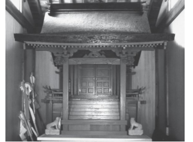
杉山神社本殿 (稲城市指定文化財)