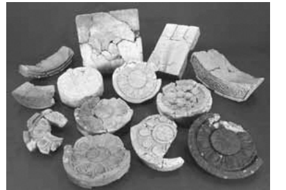
▲瓦谷戸窯跡出土の屋根瓦と塼

奈良時代の稲城が属していた武蔵国にも、武蔵国分寺が建てられました。武蔵国分寺は金堂・講堂・七重塔からなる、七堂伽藍を備えた大規模な寺院で、金堂だけでも約10万枚の瓦が使われたと言われ、寺全体ではさらに膨大な数の瓦が使われました。稲城市域