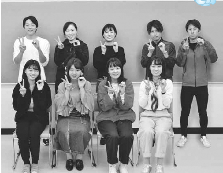
新成人を代表して、成人式実行委員9人の中から4人の抱負や思いをご紹介します。