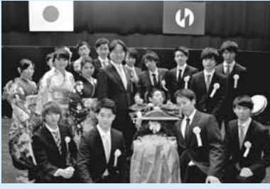
▲市長と成人式実行委員