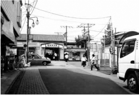
▲稲城長沼駅 (2006年5月撮影)