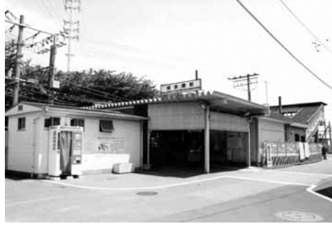
▲南多摩駅 (2006年5月撮影)