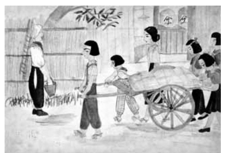
▲疎開児童が描いた絵(威光寺の景色)

郷土資料室では、このような学童の集団疎開について、関係資料や学童の描いた絵などを展示して紹介しています。