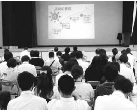
▶稲城第一中学校教員による研究報告

まず、教師が教材開発と活用的重要性を十分に理解し、教師自身が「自ら調べ、考え、表現すること」に取り組み、子供たちの良きモデルになつていました。発表会当日は、昔遊びや伝統文化などを教えてくださる地域の方々から、子どもたち自身