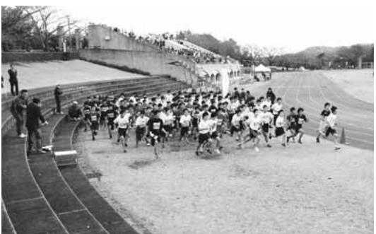
▲2年男子のレーススタートの様子

陸上教室においては、主に襷の受け渡しについての指導が行われ、襷に込められた選手の思いと、襷リレーのポイント指導が、実演を通して行われました。