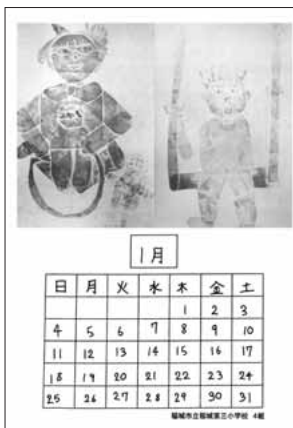
稲城市立稲城第三小学校4組の皆さんの作品です。

編集・発行 稲城市教育委員会教育部生涯学習課 〒206-8601 稲城市東長沼2111 ☎042-377-2121 042-379-0491