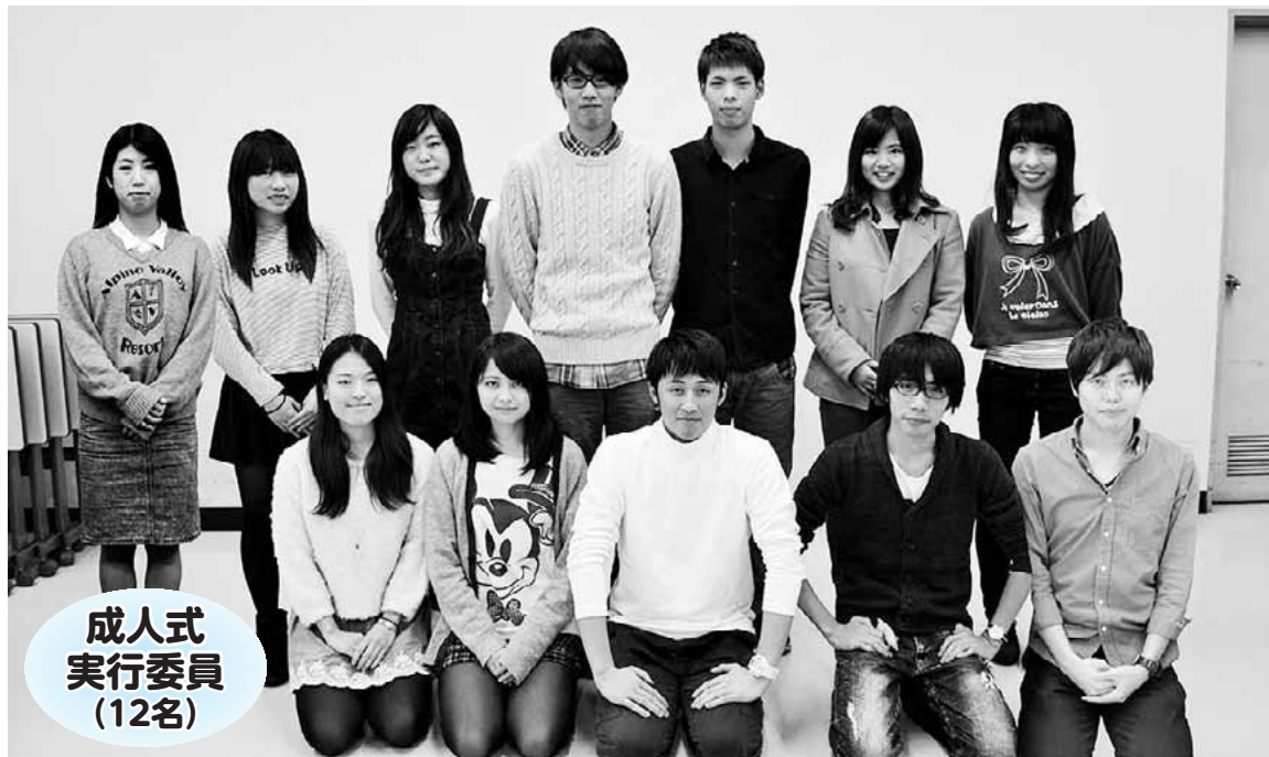
成人式 実行委員 (12名)

編集・発行 稲城市教育委員会教育部生涯学習課 〒206-8601 稲城市東長沼2111 ☎042-377-2121 042-379-0491