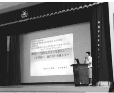
▶講師の先生による講演会 演題「共によりよく生きる」