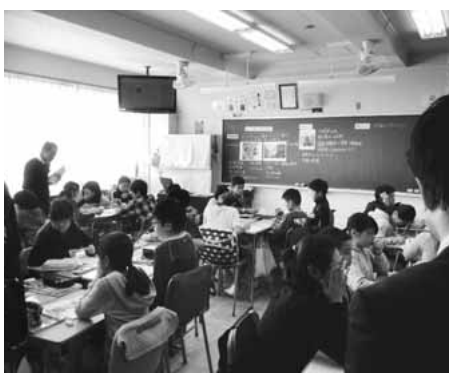
▶グループでの話し合い