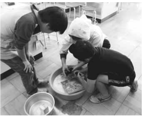
▶地域の方から洗濯板を使った洗濯方法を教わっています