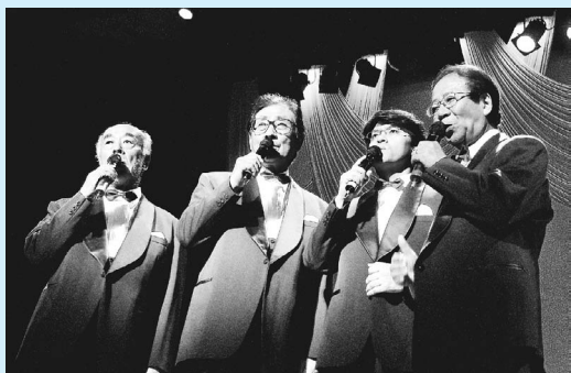
ボニージャックス (BONNY JACKS) 《プロフィール》

平成3年3月7日に制定された「稲城市平和都市宣言」を受け、平和の大切さと尊厳を共感する機会として毎年この時期に「稲城平和コンサート」を開催しています。 今回は、「ちいさい秋みつけた」などで知られる男声コーラスグループのボニージャックスが出演します。 ▽期日 3月11日(日) ▽時間 午後2時～4時(午後1時30分開場) ▽出演 ボニージャックス ▽会場 稲城市立イプラザ ▽入場料 一、五〇〇円(全席自由) ▽入場券 1月21日(土)午後2時から各文化センター、稲城市商工会の「稲城生き生き商品券」販売所にて販売いたします。