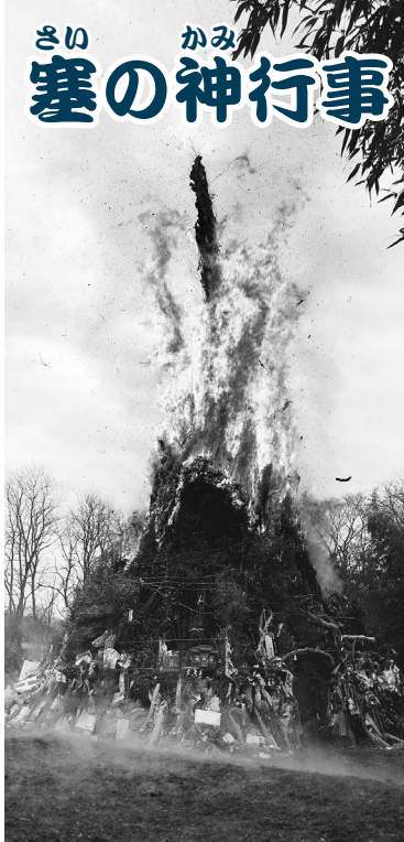
稲城市の塞の神は、青少年育成地区委員会や自治会等が中心となって行っている伝統行事です。正月飾り等を1カ所にまとめて燃やし、炎に病気や災厄を取り除くことという願いを込めて行われています。