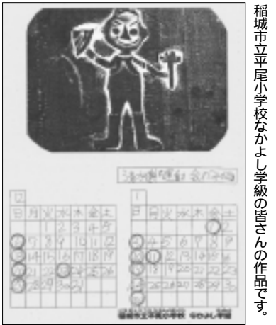
稲城市立平尾小学校なかよし学級の皆さんの作品です。

編集・発行 稲城市教育委員会 教育部 生涯学習課 〒206-8601 稲城市東長沼2111 電話 042-378-2111 FAX 042-379-3600