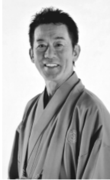
▲三遊亭 楽太郎 お茶の間でお馴染みの楽太郎さん。勢いに乗ってます。

今年も、年末恒例の稲城寄席を行います。師走のひとこと、落語と俗曲をたっぷりお楽しみください。