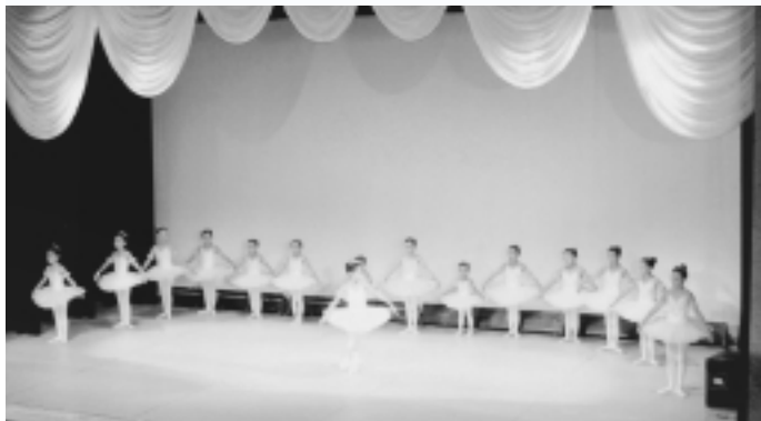
▲昨年度文化祭(ステージ部門)