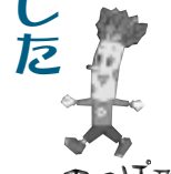
野沢温泉村の「のつぼ」と散歩の「ぼ」から名付けられました

今年で4年目になる、長野県野沢温泉村における宿泊体験学習が7月19日(日)から7月29日(水)まで実施され、市内11の小学校6年生が体験学習を行ってきました。