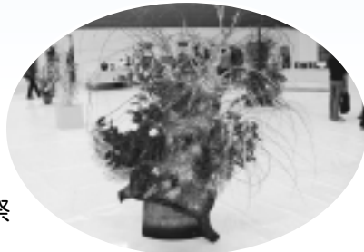
▶昨年度芸術祭(いけばな)

▷主催・問合せ 第41回稲城市民文化祭・第35回稲城市芸術祭 実行委員会事務局(生涯学習課内)内線633