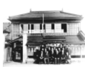
▲稲城村役場の建物(昭和25年頃)

昭和32年(1957年)4月 には人口増加を受けて、稲城町 が誕生し、同年6月には、町の 新庁舎落成式と町制施行祝賀会 が挙行されました。町村合併問 題は翌昭和33年にも再燃し、従 来の合併案を変更して、南多摩 郡東部四か町村の大同合併案が 検討されましたが、実現しませ んでした。稲城町はその後、独 自の自立した町として歩み続け