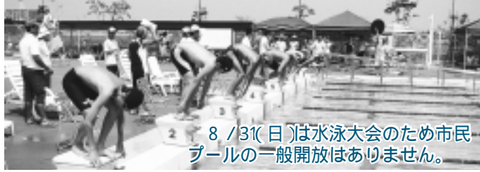
8/31(日)は水泳大会のため市民プールの一般開放はありません。