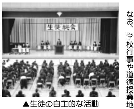
▲生徒の自主的な活動

職員の方々やPTAを中心とした保護者の方々に感謝し、全校児童でもちつきを行います。この他にも、各学年で学年菜園を利用した季節の野菜の栽培を行い、収穫した野菜を給食の時間に食べたり、学校菜園や地域の方の畑を借りて、全校でさつまいもの栽培を行い、同じく十二月にやきいも大会を行うなど、様々な農業体験学習を行っています。今年度からは、一年生が本格的な花の栽培の学習を行います。