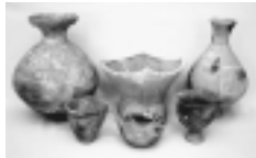
▲平尾台原遺跡出土の縄文・弥生土器

時代の遺跡から発見された各時期の土器(草創期)後(期)や土偶、各種の石器(石斧・石槍・石錘・石皿・石棒)などを展示しています。 また発掘調査された代表的な遺跡の様子を、写真パネルや図面等で紹介しています。 稲城市郷土資料室の概要 場所 ふれんど平尾2階 開館日 火・日曜日の午後1時～4時(月曜日は休館) 問合せ 生涯学習課