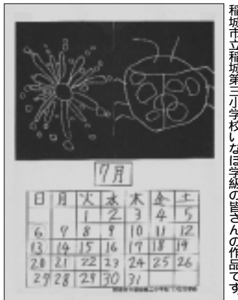
稲城市立稲城第三小学校いなぎ学級の皆さんの作品です。

編集・発行 稲城市教育委員会教育部 生涯学習課 〒206-8601 稲城市東長沼2111 電話 042-378-2111 FAX 042-379-3600