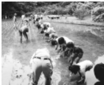
▲子供・保護者・地域のみなで田植え

本校は、地域で農業を営む方々とJA東京みなみの職員の方々、そしてPTAを中心とした保護者の方々のご指導とご支援をいただきながら、生活科と総合的な学習の時間の中で、稲作体験学習に取り組んでいます。