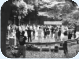
▲キャンプファイヤー研修