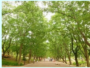
南町田 グランベリー パーク