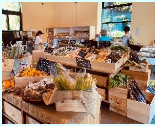
町田 薬師池公園 四季彩の杜