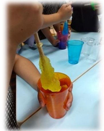
スライム作りに挑戦