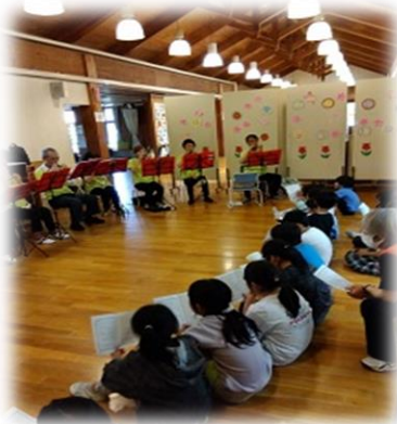
オカリナの演奏会♪