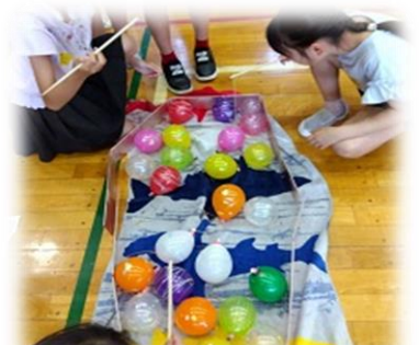
縁日 ヨーヨー釣れるかな？