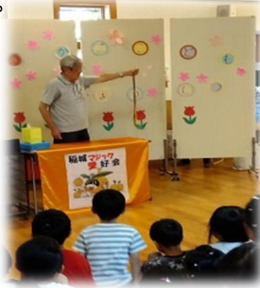
マジックの世界ようこそ！