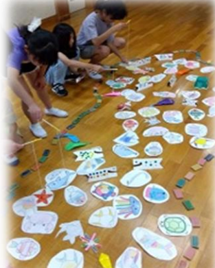
さかなつりをしよう