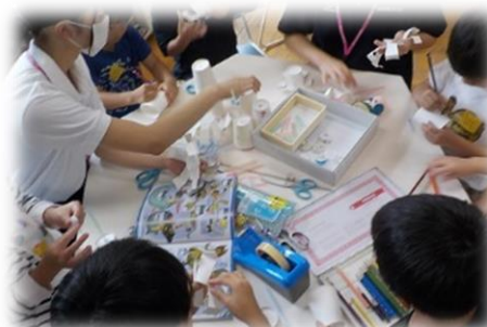
駒沢女子大学の学生さんと工作