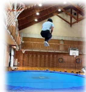
トランポリン体験