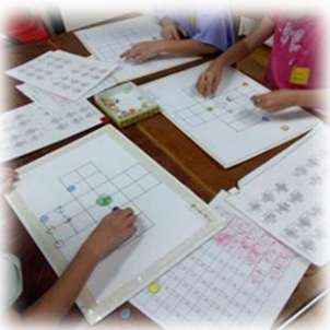
ひらめけ！オンリーワン