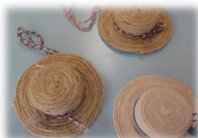
麦わら帽子のアクセサリ