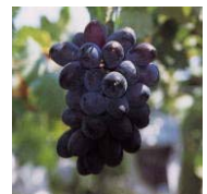
稲城の特産品：ぶどう

稲城市企画部長期総合計画担当 ☎206-8601 稲城市東長沼 2111 ☎042-378-2111 内線 537