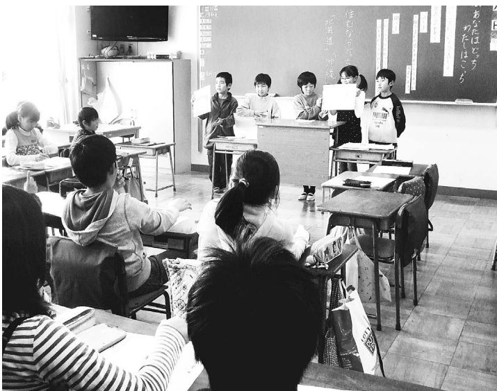
▲中学年の授業風景

本校では、平成二十二・二十三年度稲城市教育委員会教育研究奨励校として、研究主題『伝え合う力を育てる』、「伝え