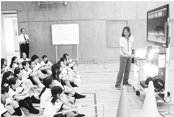
▲保健体育(マット運動)の授業風景

本校では、平成二十二・二十三年度の二年間、研究主題『進んで学び深く考える生徒の育成』生徒の意欲を高めるための指導の工夫』をテーマに取り組んできました。本校の教育目標とも重なっており、いかに「生徒の意欲」を高めるか、喫緊の