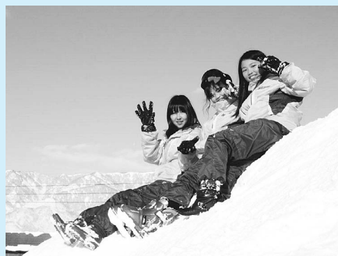
▲快晴となった最終日

夜には宿舎の方々と交流がありました。餅つきをしたり、スノーモービルにのりに乗ったり、小正月のお飾り用の団子を作ったりなど、宿舎ごとに体験内容は違いましたが、宿舎の方々が心をこめて準備をしてくださったおかげで、とても有意義な体験をすることができました。そして最終日。それまでの悪天候から一転して、快晴となりました。青空に映え、きらきらと光り輝く雪の美しさの中で、心ゆくまで雪遊びをし、大雪との別れを惜しみました。その後は閉校式。宿舎の方々と握手をかわし、名残惜しげうにバスに乗る生徒たちの姿から、生徒の実行委員が考えたスローガン『Challenge絆を深め心に残る思い出を』が十分に達成できたことが伝わってきました。