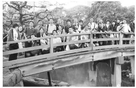
▲去年10月バスハイク(浜離宮庭園)