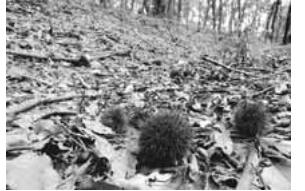
「城山公園を散策」 (稲城市フォトギャラリー投稿作品)