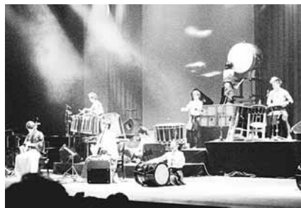
▲和楽器の魅力をお楽しみください

※シャトルバスの停留所は次のとおりです。 ● iバスの停留所 ◎ 京王バスの停留所 △ 臨時停留所 ※運行間隔については、交通事情により変わります。