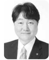
稲城市長 高橋 勝浩

本市では実災害への派遣を通じて得た教訓を、地元が被災した際に活かせるよう、より一層実践的な防災訓練を励行するとともに、単独で消防本部を運営するメリットを享受し、災害時における東京都・警察・自衛隊との連携にも努めてまいります。