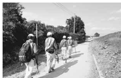
▲行方不明者の搜索活動

でも豪雨は続き、10日午前8時過ぎに総務省消防庁から近隣各都県あてに緊急消防援助隊の出動準備の依頼がありました。