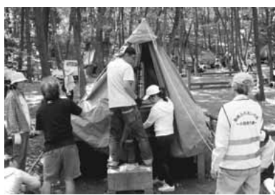
▲稲城ふれあいの森でのテント設営作業の様子

地域行事、稲城ふれあいの森等でのキャンプ、農業体験、ラジオ体操、夜間パトロール 委員を募集しています 子どもたちも大人も楽しめる