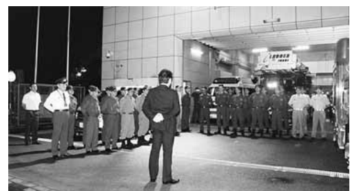
▲緊急消防援助隊が出発する様子

12月4日(金) 午後3時30分 稲城第三中学校 ☎377-7151 問学務課学務係