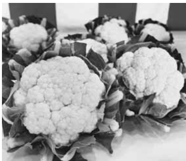
▲東京都知事賞野菜の部「カリフラワー・オレンジ美星」