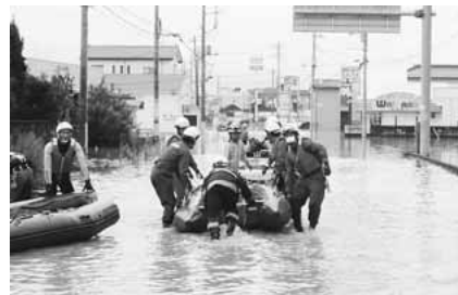
▲ボートを活用した救急支援物資の搬送

本市では被害もなく安堵していましたが翌日になって、1次派遣隊は消防小隊(ポンプ車1台)5人・救急小隊(救急車1台)3人・支援小隊(大型バス1台)3人の体制で臨み、13日までの3日間の活動をしました。稲城部隊の活動実績は50人の救助と重症患者等4人の救急搬送です。浸水した範囲は地域の3分の1ともいわれており、持参したゴムボートが活躍しました。1次派遣隊は十分な休憩をとることもできずに当初