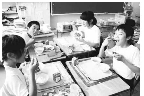
▲みんなで仲良く、おいしくいただきます