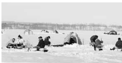
▲氷上わかさぎ釣り