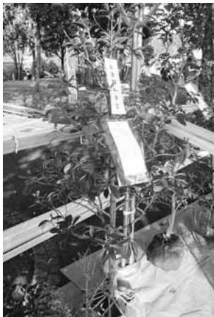
▲東京都知事賞 植木・花卉・盆栽の部「植木・モッコク」