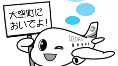
▲大空町シンボルキャラクター そらっきー

羽田空港から女満別空港(大空町)まで約1時間50分です。女満別空港から大空町市街地へは路線バスが便利です。