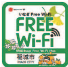
いなぎ Free Wi-Fi のステッカー