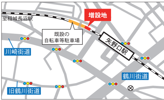
矢野口駅西自転車等駐車場