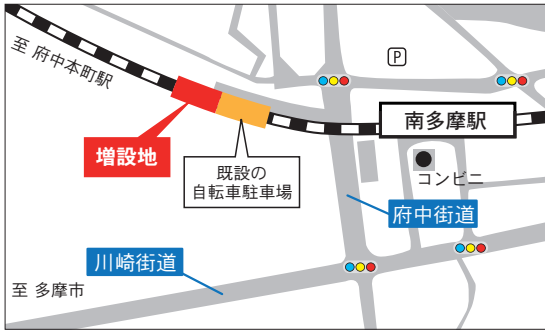
南多摩駅西自転車等駐車場