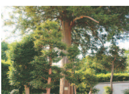
市内にある保存樹木