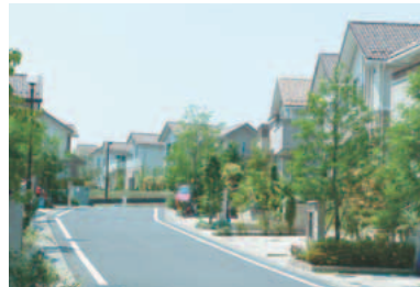
▲住宅の色彩と緑が調和したまちなみ

都市計画案の縦覧 都市計画案の縦覧を行います。次の案にご意見のある方は、縦覧期間中に意見書を提出することができます。 ☎5月27日(月)~6月10日(月) 時午前8時30分~午後5時 場都市計画課窓口 ※土・日曜日は市役所1階当直員室前で閲覧のみ可 ☎多摩都市計画地区計画 ①向陽台地区地区計画の変更 ②向陽台東地区地区計画の変更 ☎都市計画課景観と地区計画係