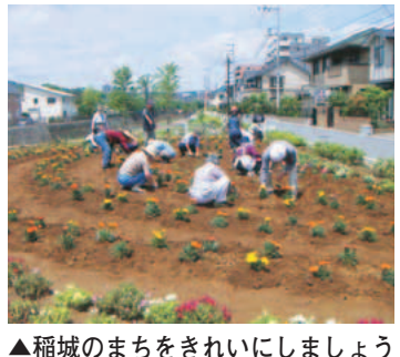
▲稲城のまちをきれいにしましょう