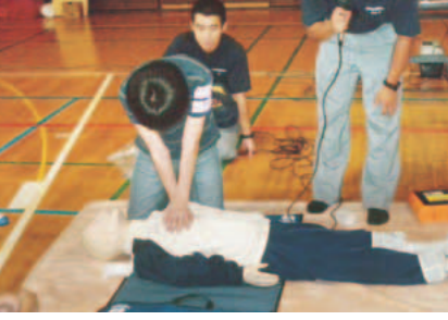
▲実技を交え、丁寧に指導します。

除細動器)等の取り扱いを学びましょう。 ▽市内在住・在勤・在学中の学生以上の方 6月2日(日) 午前9時～午後6時 場所 消防署講堂 定員 20人(申込先着順) ※受講者には救命技能者として上級救命講習修了証(2年間有効)を交付 ▽心肺蘇生法、AED取り扱い、三角巾使用法、搬送法など ▽電話 先 消防課救急係 ☎377・7119 救急車は適正に利用しましょう