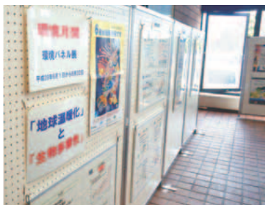
▲過去の展示の様子

郵便等による不在者投票。身体に一定の障害がある方などで、表1に該当する方は、郵便等により自宅などで投票ができます(要事前申請)。