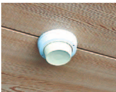
▲住宅用火災警報器

報器の設置・維持管理、火気・電気器具の取り扱い等に関するアドバイスとアンケート調査を行います。 ※消防職員が身分証明書を持って訪問します。 ▽65歳以上の高齢者世帯、救急医療届出加入者 7月1日(月)～令和2年3月19日 ▽消防課査察指導係 ☎377・7119