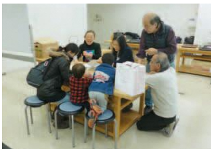
▲大切なおもちゃを治します

定20組程度(予約者優先) 費無料(部品交換の場合は実費負担) ※おもちゃは1組3点まで