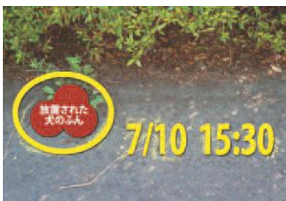
▲チョークで注意喚起

なければなりません。なお、犬のふんの放置が確認された場合、黄色いチョークで注意を促します。