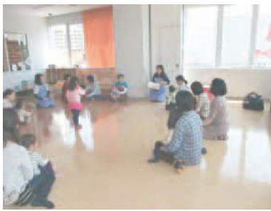
親子の交流をお手伝いします