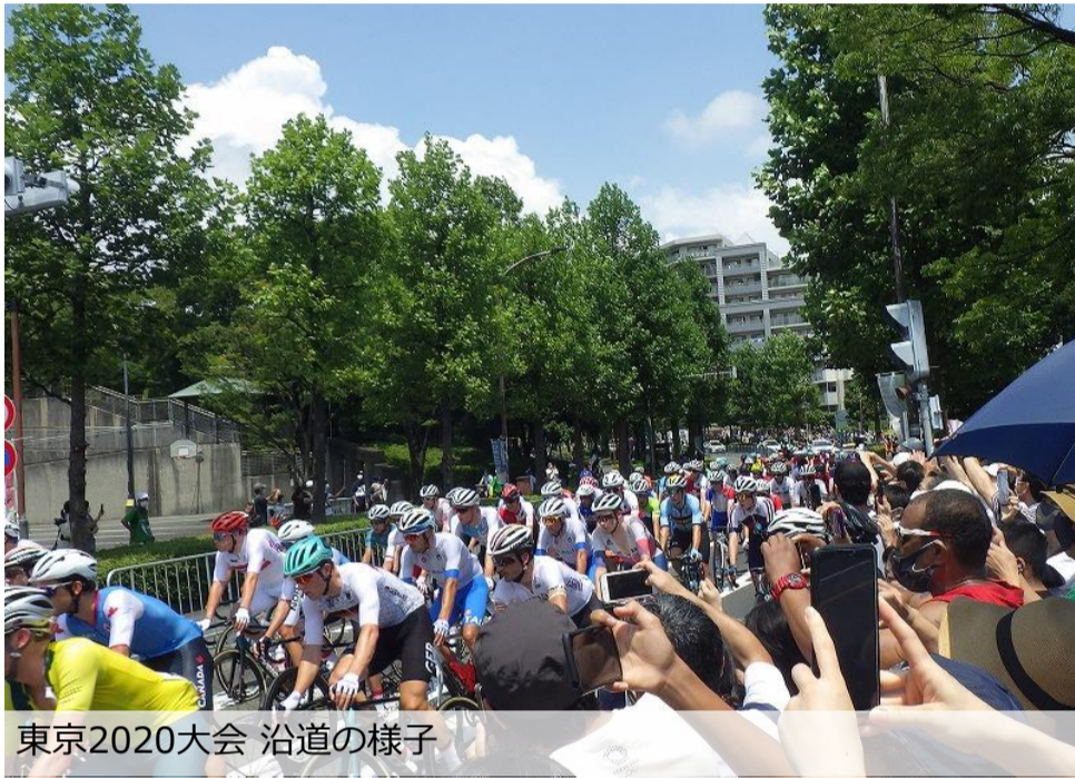
東京2020大会 沿道の様子

その東京2020オリンピックから2年が経過した今年、東京都が東京2020オリンピックと1964年東京五輪の自転車ロードレース競技のコースを中心にコース設定した自転車ロードレース大会「THE ROAD RACE TOKYO 2023」を12月3日に開催することを公表しました。