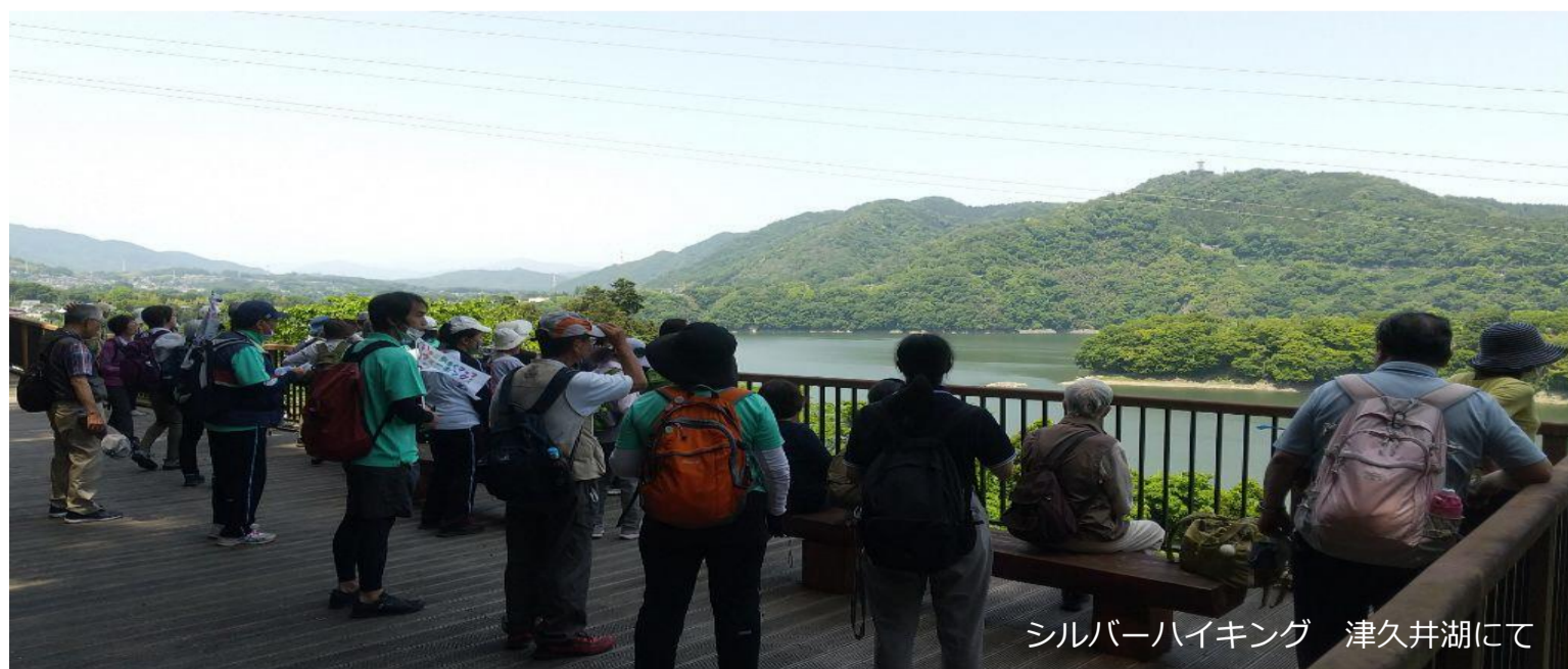
シルバーハイキング 津久井湖にて