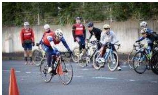
サイクルスクール