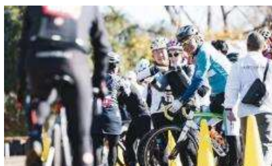
80分サイクルマラソン