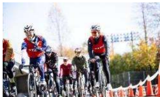
ガイド付きショートレース