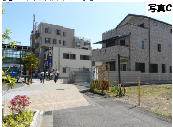
【③ 駅前広場整備工事】

■ 写真 C、D 駅前広場の一部歩道部分(写真C)を整備することで、駅前広場が完成いたします。 また駅前広場に面した換地先(写真D)の整地工事を行います。