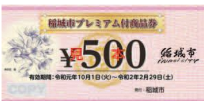
▲プレミアム付商品券見本

経済観光課商工係プレミアム付商品券担当 401-6637 (平日午前9時〜午後5時)