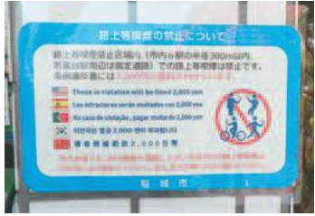
▲民有地への啓発物設置(ファミリーマート京王稲城駅前店)