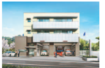
▲上平尾消防出張所 (完成イメージ)