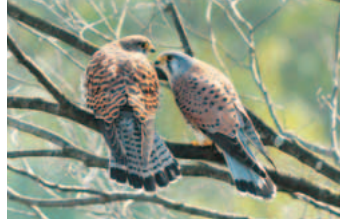
市の鳥「チョウゲンボウ」