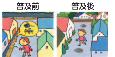
下水道が普及すると蚊やハエの発生が少なくなり住みやすい街になります。