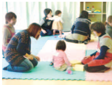
▲子育てサポーターと遊ぶ様子