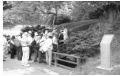
多摩サービス補助施設内を散策しませんか

日米親善事業の一つとして、多摩サービス補助施設内での散策、自然観察が行えます。 期日 10月25日(木)・26日(金)・31日(水)、11月1日(木)・2日(金)・7日(水)・9日(金)のうち2日間 会場 米軍多摩サービス補助施設(大丸) 利用規定で定められたエリアに限りです。 対象 市民で構成された