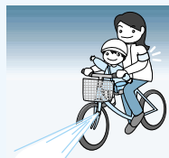
夕暮れ時と夜間の歩行中・自転車乗用中の交通事故防止