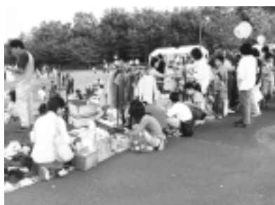
昨年のフリーマーケットの様子

京王相模原線京王よみうりランド駅とJR南武線矢野口駅を結ぶ弁天通り商店会で、商業振興と地域交流の活性化を目指し、姉妹都市・北海道大空町の「大空町物産フェア」を開催します。 期間中、大空町の農畜産物や特産品、また農産物で作った食品などを弁天通り商店会の各店舗などで販売します。 詳細は、広報いなぎ10月1日号でお知らせします。 期間 10月10日(水)～14日(日) 時間 10時～4時30分 会場 弁天通り商店会 問い合わせ 経済課商工係、弁天通り商店会(代表 石田) ☎377・7625