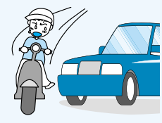
二輪車の交通事故防止

スクール(京王線百草園駅下車徒歩1分) 交通安全駅頭キャンペーン 期日 9月26日(水) 時間 午前7時30分 会場 稲城駅前 二輪車・自転車ストッパ作戦 期日 9月29日(土) 時間 10時 会場 矢野口・稲荷神社