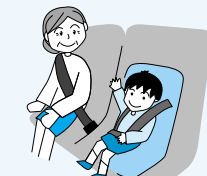
後部座席を含むシートベルトとチャイルドシートの正しい着用の徹底