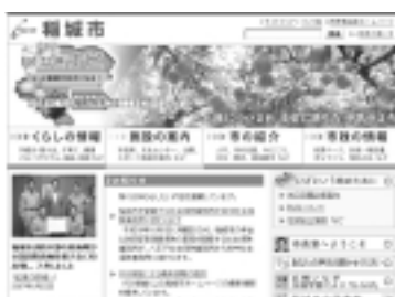
市ホームページのトップ画面