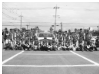
違反広告物撤去協力員

違反広告物の撤去 市民の手で違反広告物の撤去ができる制度を整え、活動を開始しました。 市民オンブズパトロン 制度の検討 市立学校アドボカシー相談室を稲城第六中学校内に開設しました。