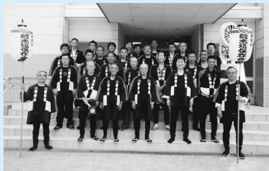
▲矢野口纏木遣り保存会