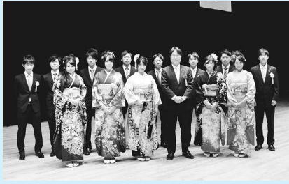
▲市長と成人式実行委員