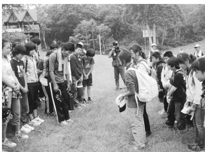
▲新しい「心の交流」を終えて…お別れです

学校に戻ってからの、子どもたちの感想には、「野沢の皆さんとの交流」「友達との交流」「喜び」「感謝」という言葉が数多く入っていました。今回の活動をきっかけに、稲城市内の子どもたちと野沢の子どもたちとの交流が、どんどん広がっていき、よいと感じる三時間でした。