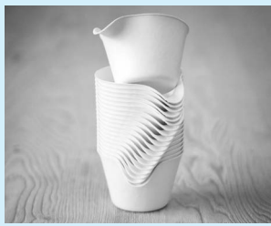
▲コーヒーカップ 株式会社WASARA

本展覧会では、紙の歴史、暮らしの中での役割、芸術的側面から日本における紙文化を紹介いたします。