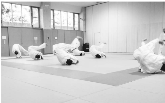
▲前回り受け身(連続)の実技研修

昨年の夏季休業中に、国士舘大学柔道部の成田先生を講師として開催しました。柔道着の着方、たまたみ方、礼法等から始まり、基本動作(姿勢、組み方、崩し等)、安全に柔道を行うための受け身、投げ技(大腰等)、固め技(けき固め・横四方固め等)など、安全面を重視した丁寧な指導方法を学ぶことができました。参加者からは、「基本的な内容が多く、とても充実した研修でした。」との声がたくさんあ